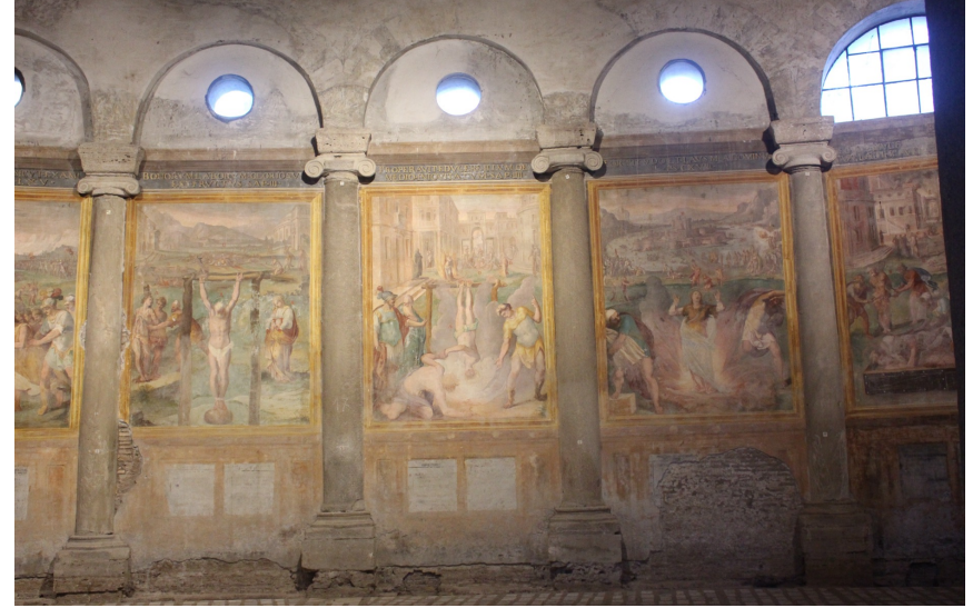
Martyriumsabbildungen in Santo Stefano Rotondo