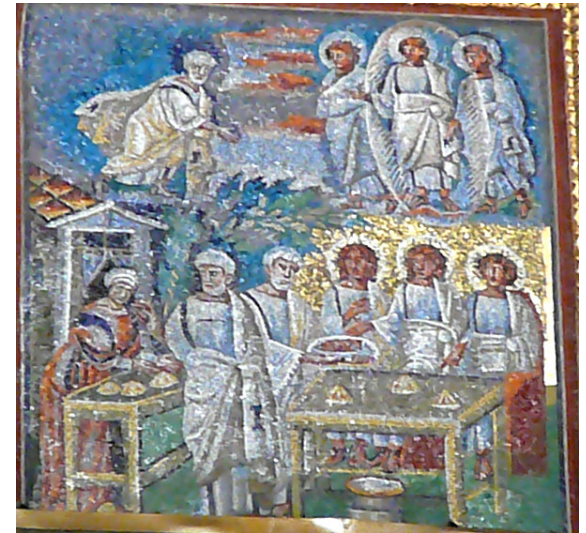
Santa Maria Maggiore (Seitenschiff-Mosaik)