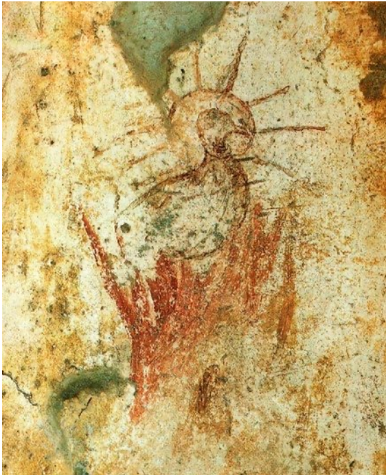
Phönix in einem Deckenfresko der Priscilla-Katakomben (Mitte 3. Jhd.)