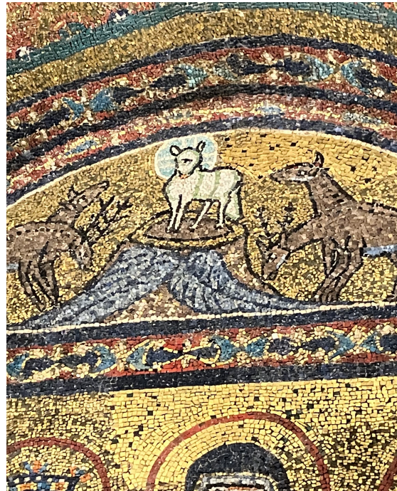
Santa Prassede (Zeno-Kapelle)

Lamm umgeben von Paradiesischen Flüssen und trinkenden Hirschen