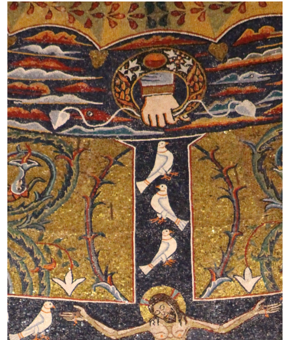
Apsis-Mosaik San Clemente