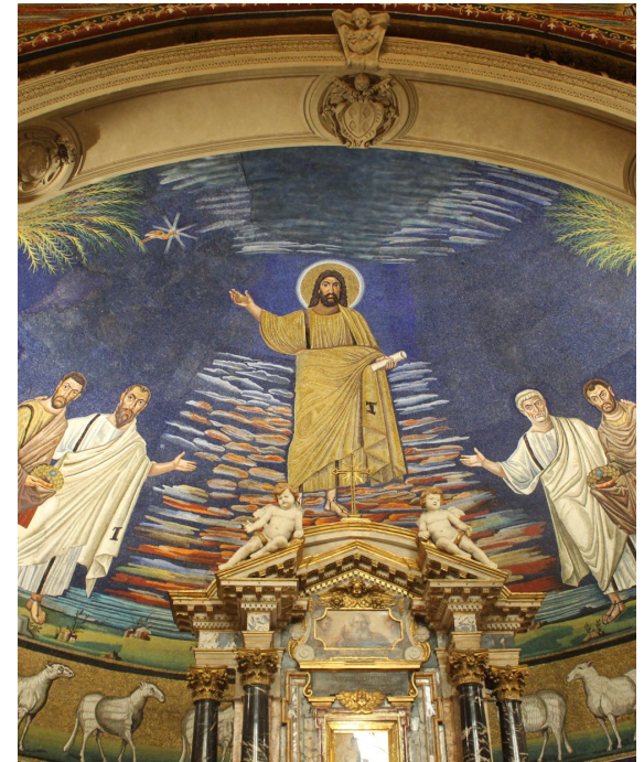
Phönix im Apsis-Mosaik der Kirche SS. Cosmas e Damiano