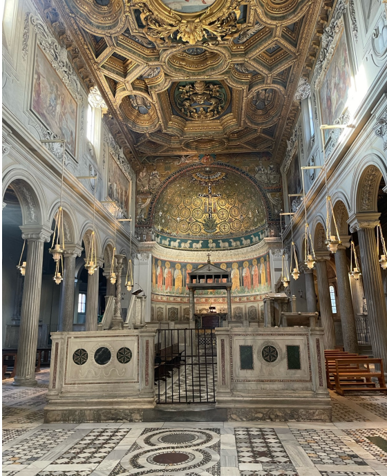
Schola cantorum in der Kirche San Clemente