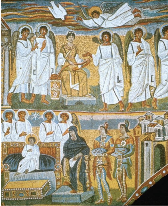
Santa Maria Maggiore (Triumphbogen)