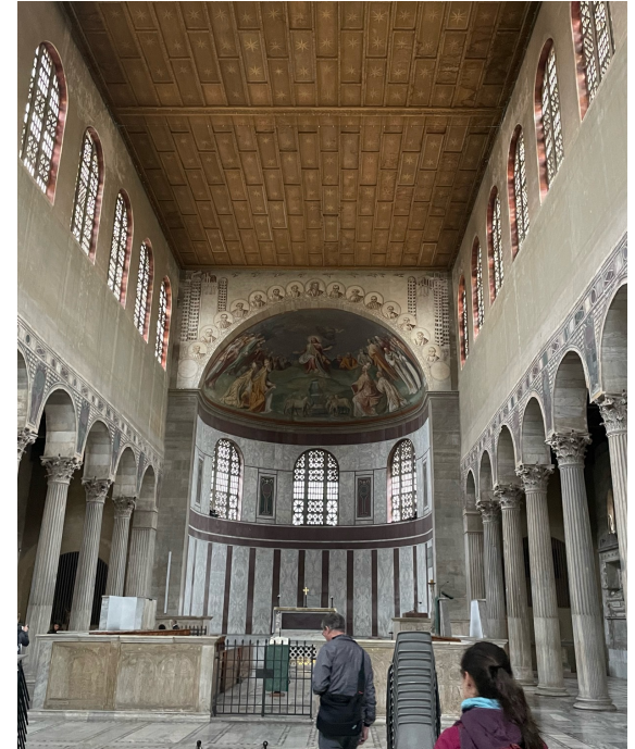
Schola Cantorum in der Kirche Santa Sabina