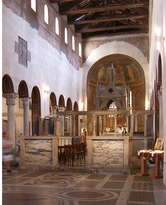
Schola Cantorum in der Kirche Santa Maria in Cosmedin