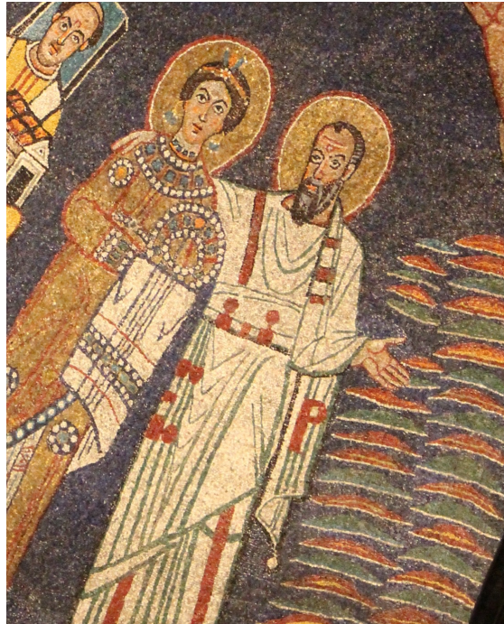
Paulus führt Praxedis Apsis-Mosaik Santa Prassede