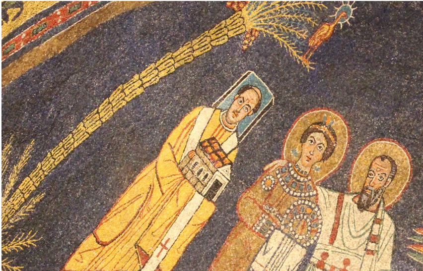
Papst Paschalis I. Apsis-Mosaik der Kirche Santa Prassede