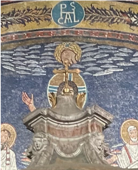
Apsis-Mosaik Santa Prassede