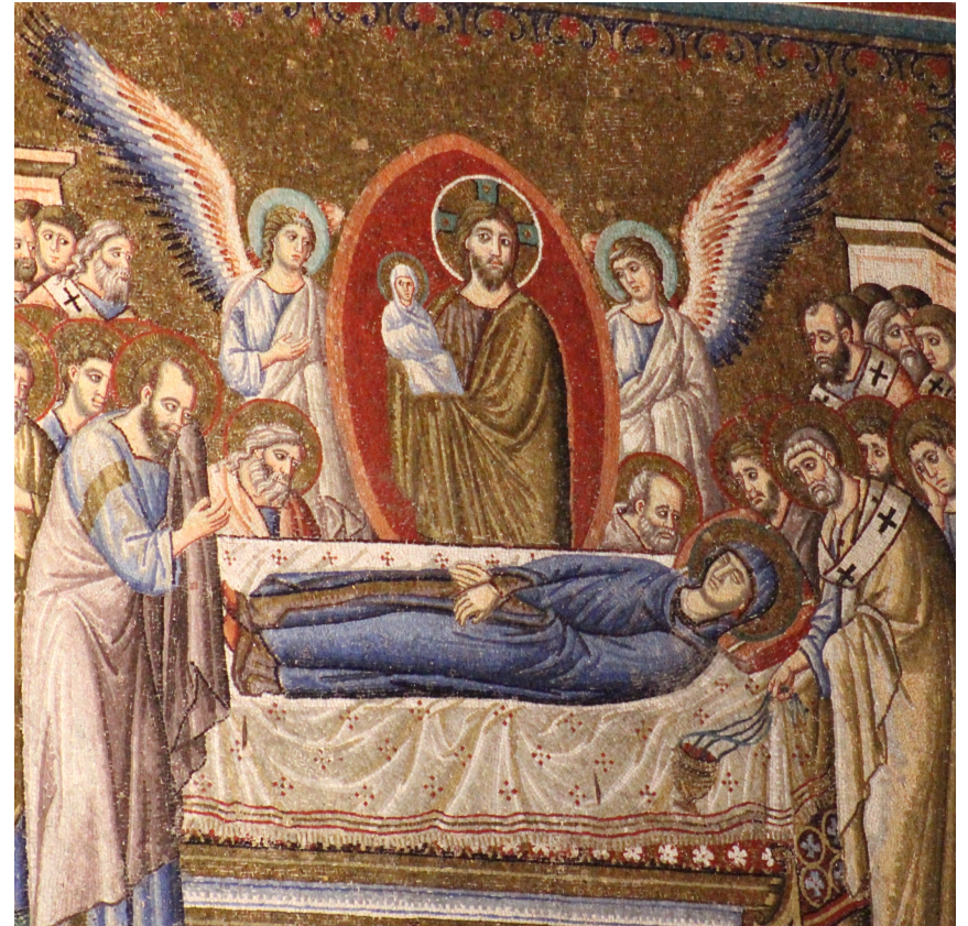
Santa Maria in Trastevere