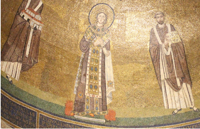
Apsis-Mosaik der Kirche Sant'Agnese Feuer und Schwert zu Füßen