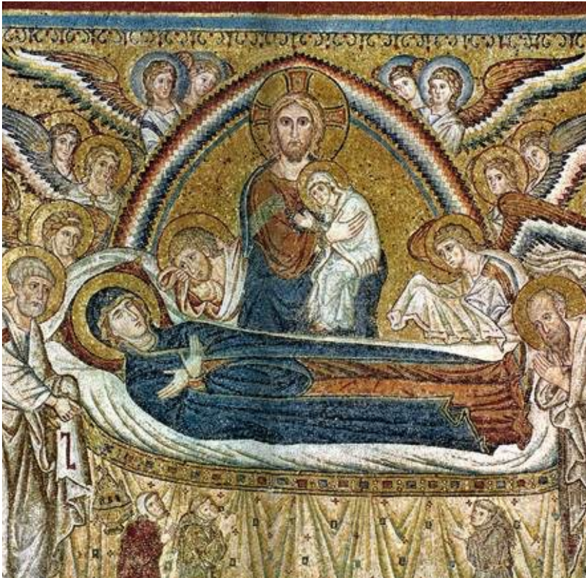
Santa Maria Maggiore