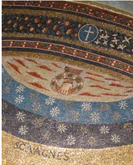
Apsis-Mosaik Sant' Agnese