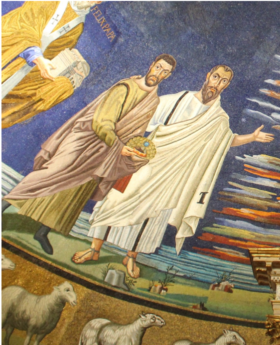
Paulus führt Kosmas Apsis-Mosaik SS. Cosmas e Damiano