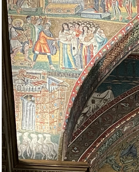
Santa Maria Maggiore (Triumphbogen)