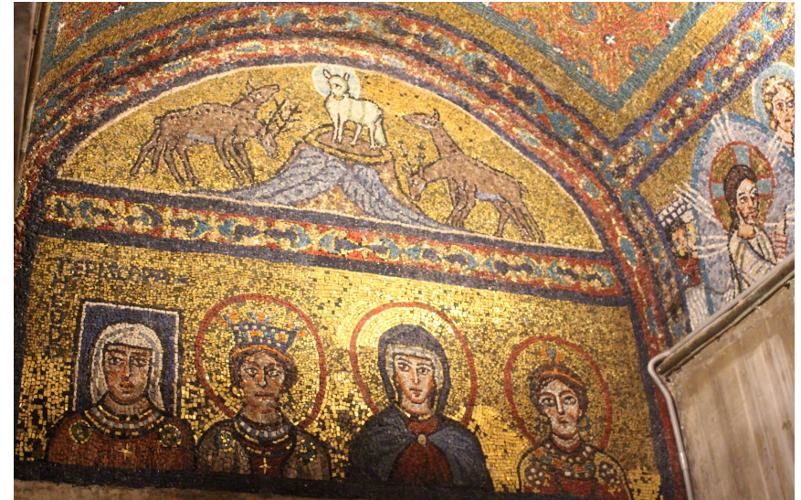
„Theodora Episcopa“ Mutter von Paschalis I. Zeno-Kapelle in Santa Prassede