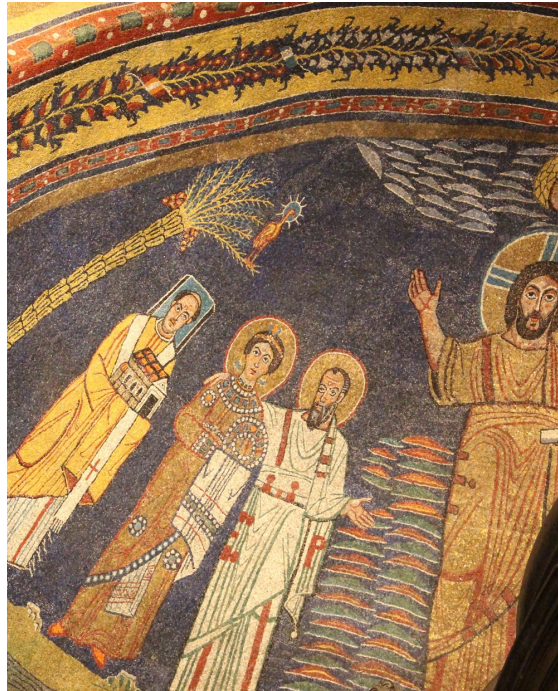
Phönix im Apsismosaik von Santa Prassede