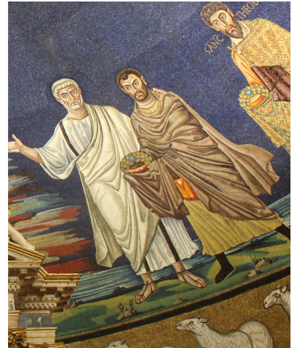
Petrus führt Damian Apsis-Mosaik SS. Cosmas e Damiano