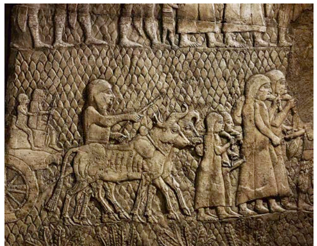
Szene aus dem Lachisch-Relief. Ninive, um 700 v. Chr.

This talk presents a framework for studying deportations to and from the southern Levant during the Age of the Mesopotamian empires. It begins with contextualizing the deportations within Assyrian colonial policy meant to serve imperial interests in the southern Levant. After which, it provides an overview of the existing evidence regarding the life of deportees and their interaction with the host societies in the southern Levant on the one hand and Assyria and Babylonia on the other hand. The last portion is dedicated to the aftermath of the deportations, which primarily deals with the possible scenarios for the fate of the communities of deportees in the southern Levant in the wake of the collapse of the Assyrian empire and the deterioration of the region following the Babylonian conquest.