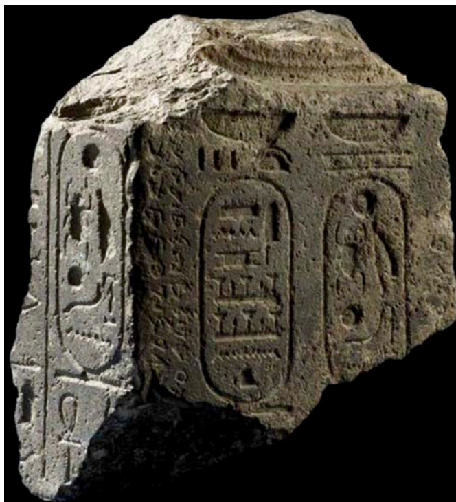
Fragment einer Sitzstatue Scheschonqs I. (VA 3361). Pergamonmuseum Berlin.

Der Vortrag bietet auf der Basis archäologischer und epigraphischer Quellen eine Gesamtsicht auf die Entwicklung im 10. und 9. Jh. und stellt u.a. eine neue Deutung der sogenannten „Byblos-Statuen“ der ägyptischen Pharaonen Scheschonq I., Osorkon I. und Osorkon II. vor.