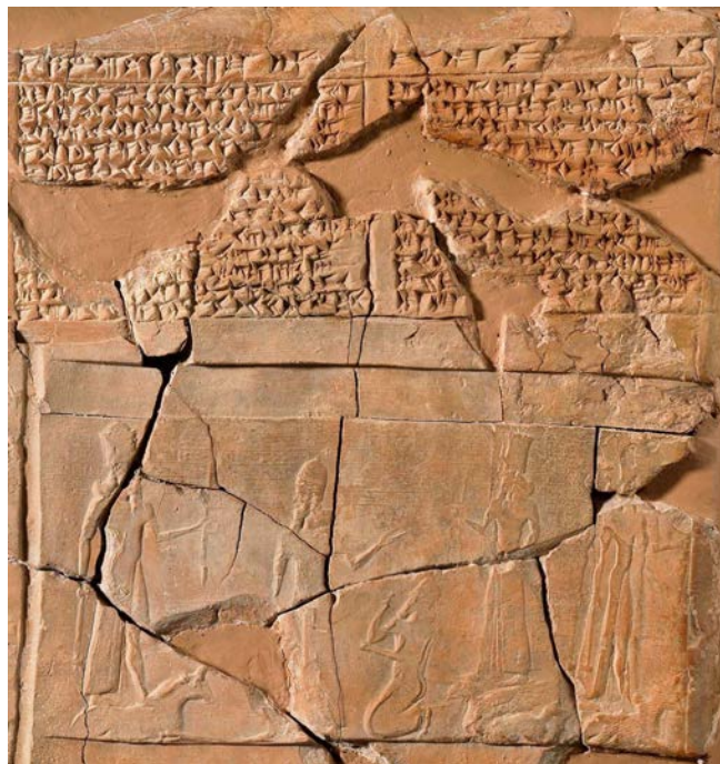
Ausschnitt aus dem Nachfolgeeid Asarhaddons (BM 132548). Nimrud, 7. Jh. v.Chr.

Prophetie spielte im Alten Orient und besonders in Israel eine entscheidende Rolle in der politischen Entscheidungsfindung. So bestand eine große Gefahr darin, auf Grund falscher oder falsch verstandener prophetische Worte eine problematische politische Option zu wählen. Aus diesem Grund gibt es der Hebräischen Bibel zahlreiche Texte, die die Problematik von lügenden Propheten, Bestechlichkeit und Selbsttäuschung thematisieren. So wird etwa in Dtn 18 dem Propheten, der spricht, obwohl er nicht von Gott geschickt wurde, der Tod angesagt. In mesopotamischen, griechischen und alttestamentlichen Texten finden sich zudem Berichte über getötete Propheten. Doch gab es wirklich eine Todesstrafe, wie oft angenommen wird? Und in welchen Fällen war diese anzuwenden? Es gilt neu nach den Begründungen für diese Todesfälle in literarischer, religiöser und politischer Hinsicht zu fragen!