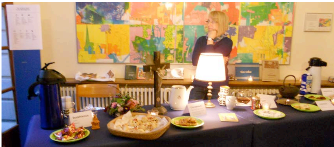
Willkommen am Nadelberg 10 zu „Tee und Gebäck der Weltreligionen“ an der UniNacht 2015